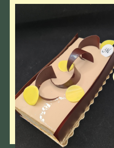
Best of 2021 «Grand Thomas»

Biscuit noisette, crème légère au caramel, sur un lit de poires pochées à la vanille de Madagascar. Taille 6 personnes