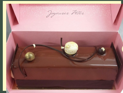
Best of 2023 «La Caramélia»

Biscuit chocolat ultra moelleux aux éclats de noisettes, caramel beurre salé onctueux, mousse légère au chocolat noir 65%, pâte sablée chocolat. Taille 4 ou 6 personnes