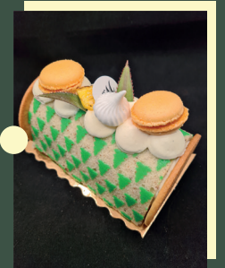
Best of 2020 «La Victoria»

Biscuit chocolat ultra moelleux, biscuit joconde décor, croustillant coco, insert exotique, ananas victoria poêlés, crème légère à la vanille de Madagascar. Taille 6 personnes